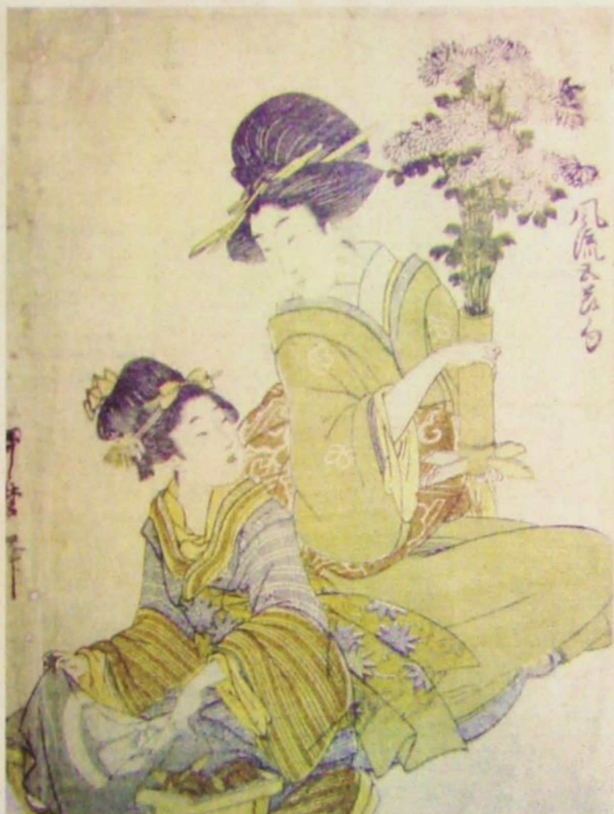
Китагава Утамаро - Две жене са вазом Кику 1800.