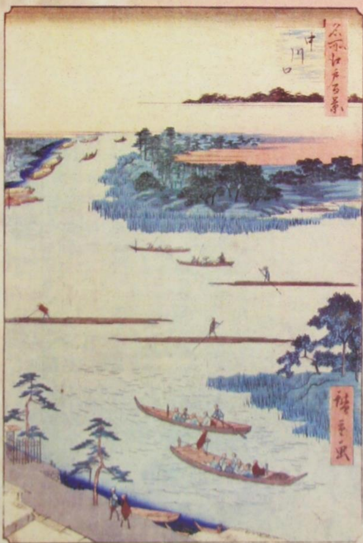
Андо Хирошиге - Сјо чувених погледа на Едо - Уиће реке Нака 1857.