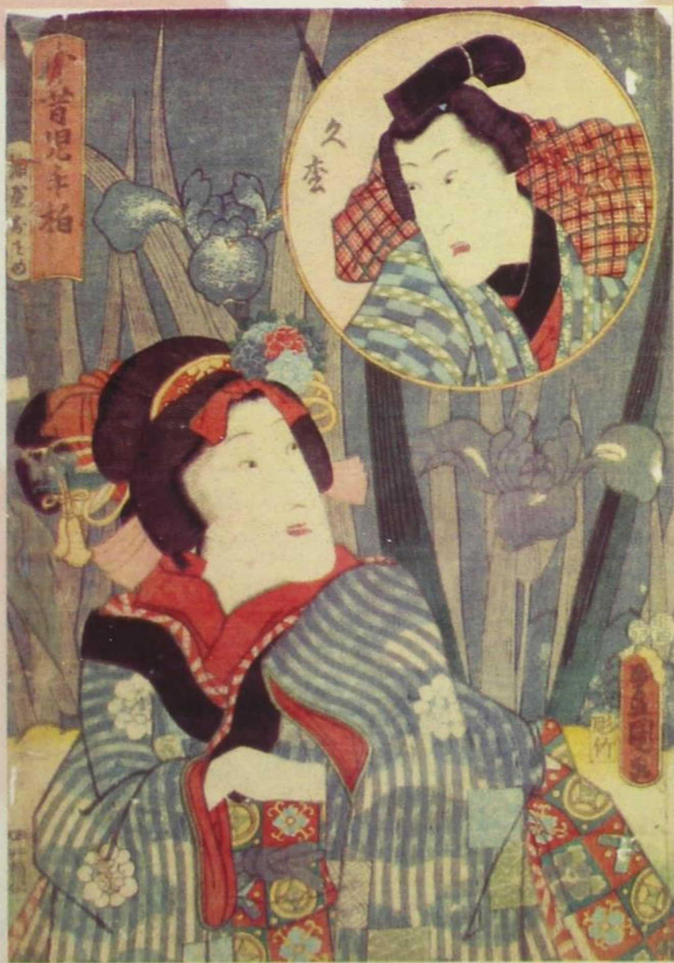
Тојокуни Ш, Жена и човек ен бусиѐ, око 1850.