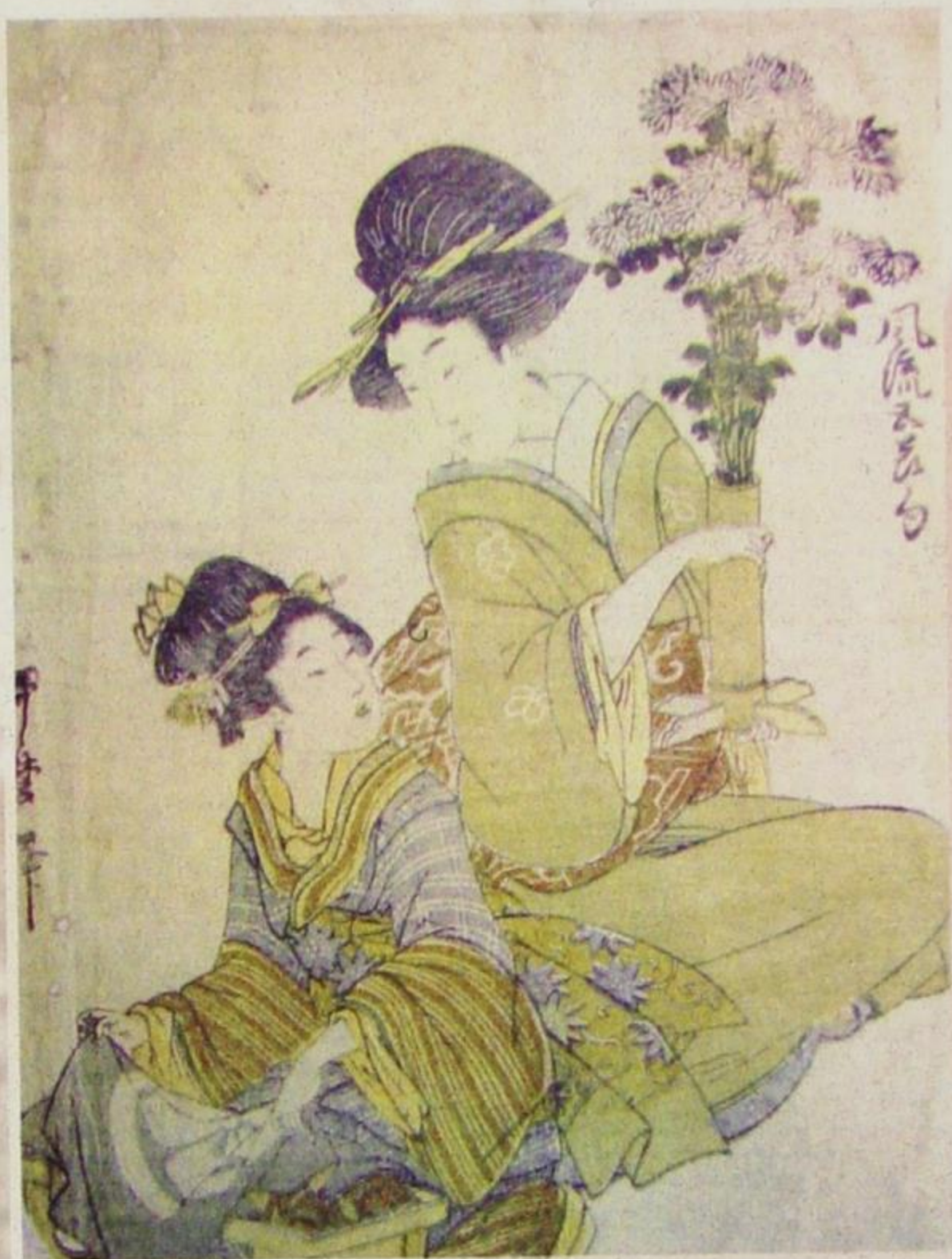
Китагава Утамаро - Две жене са вазом Кику 1800.