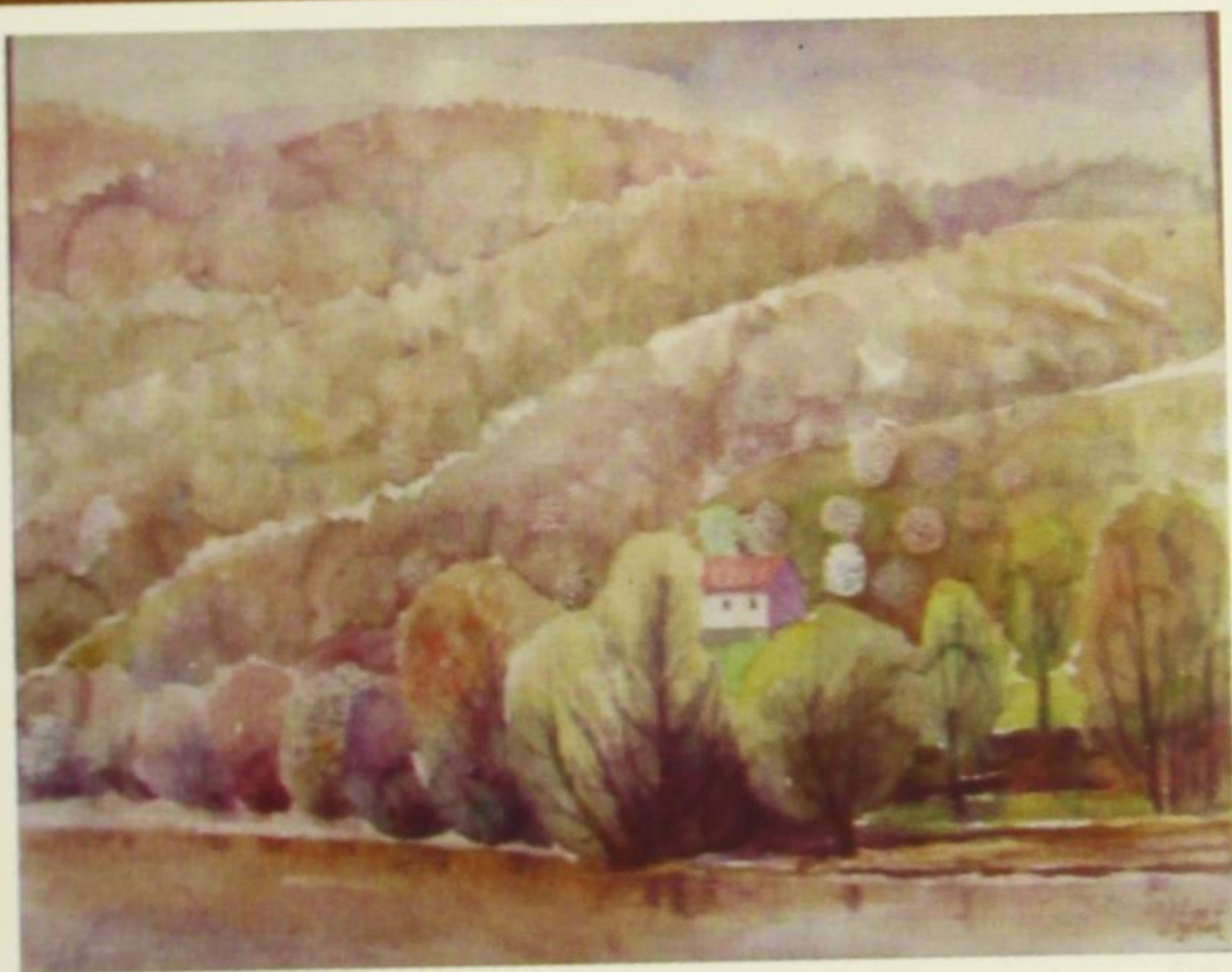
Јесењи мотив са Власине, 2003.