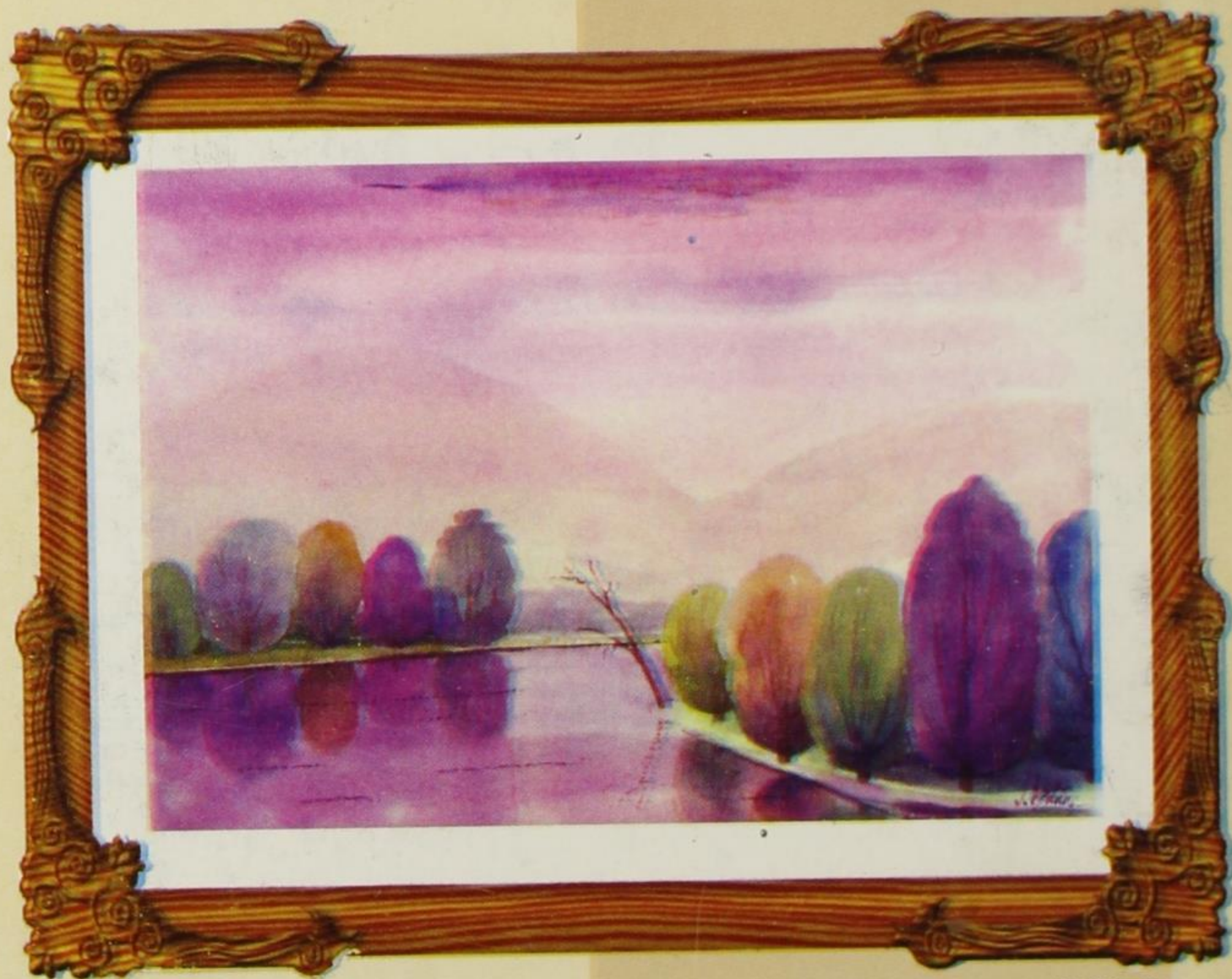
Мотив са Власине, 2000.