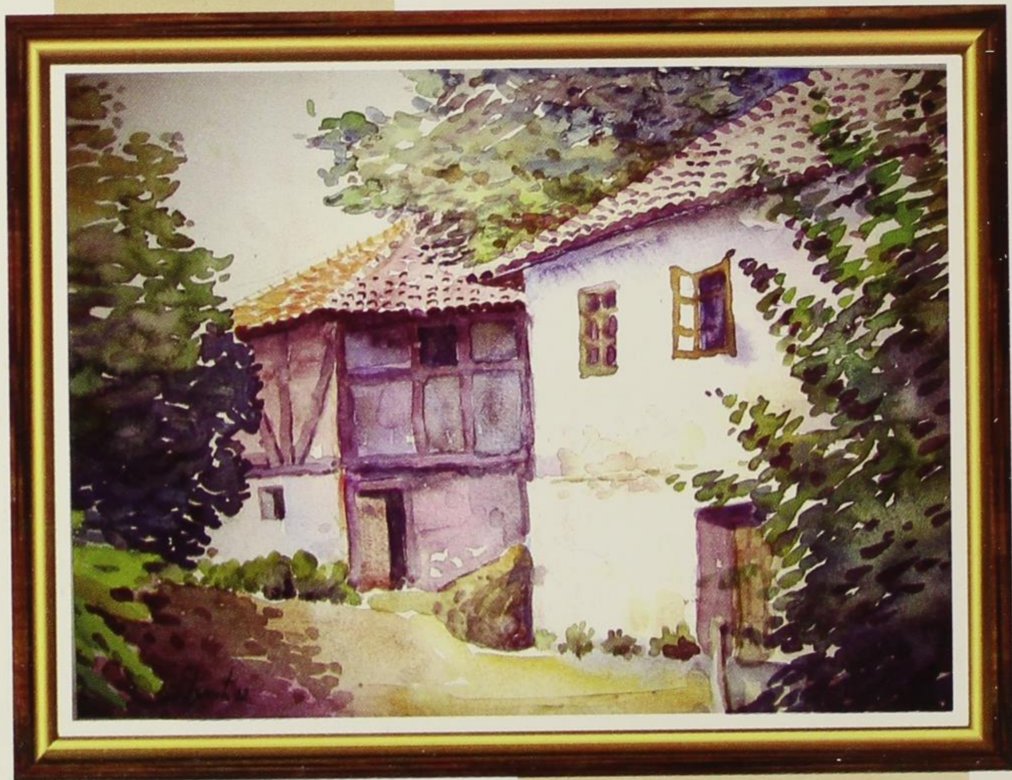
Село Дејан, 1992.