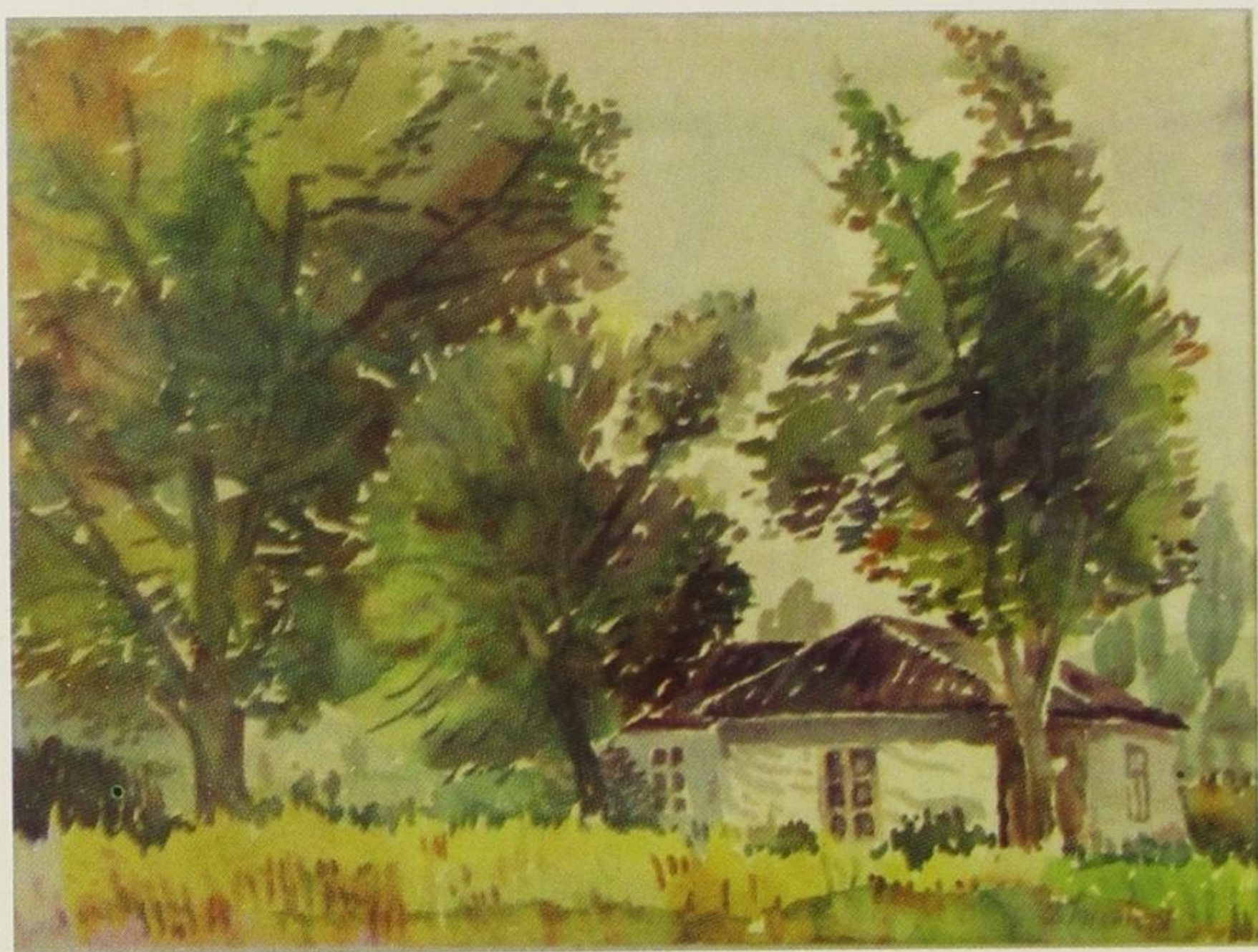
Ромска кућица, 1981.