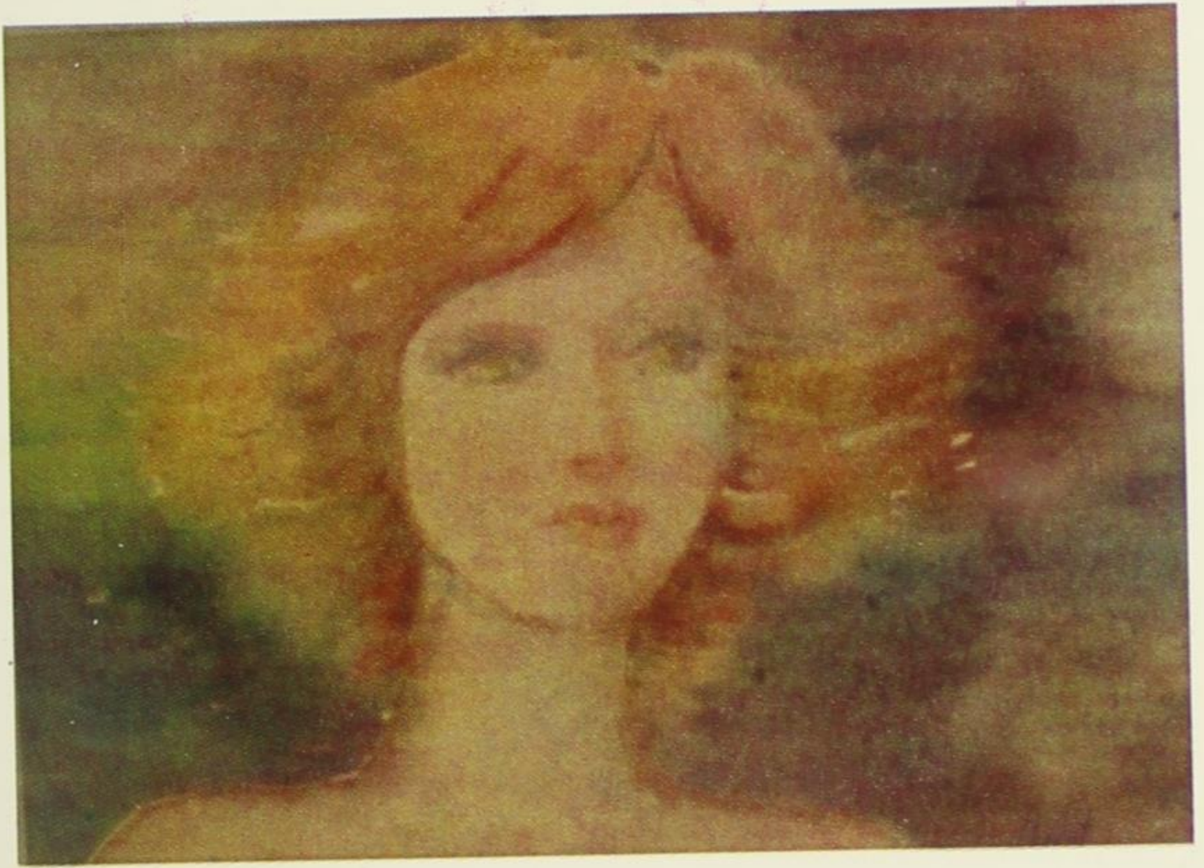
Портрет девојке, —