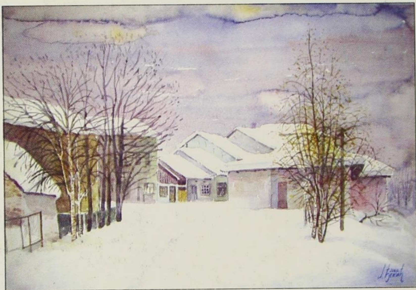
Улица поред потока, 2002.