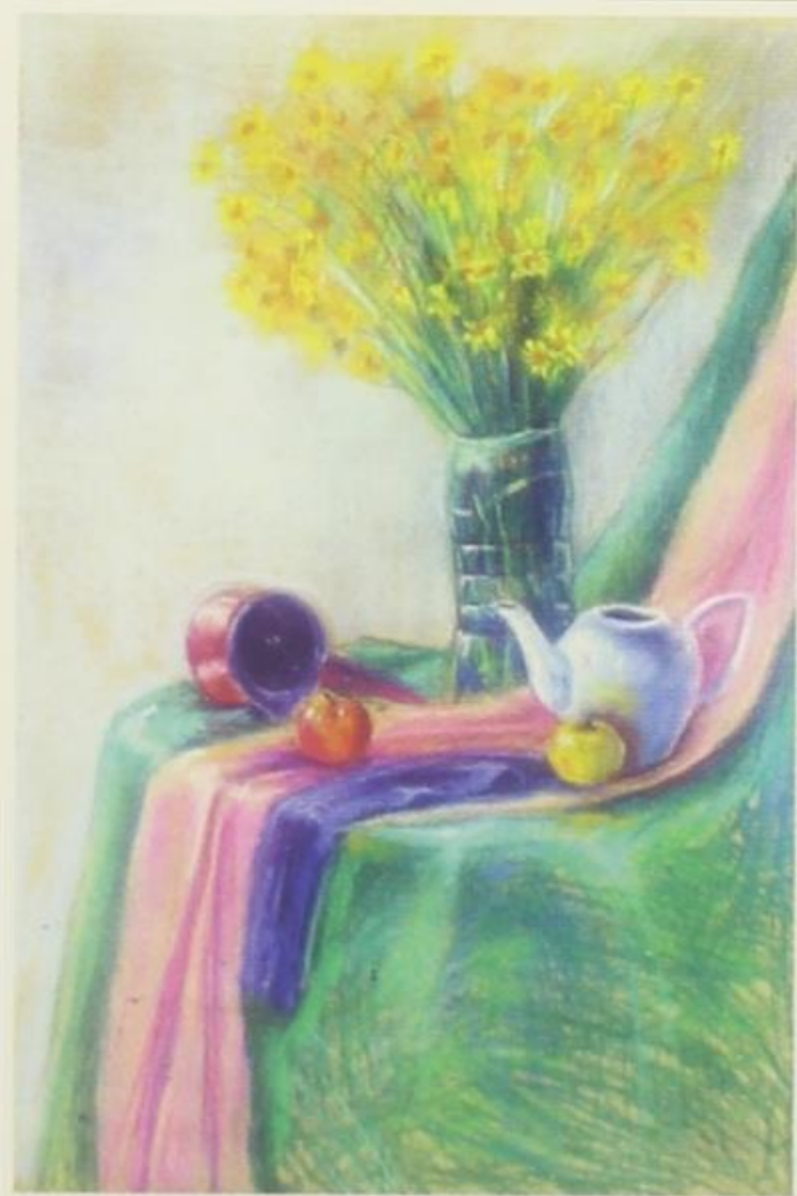
Мрїва йрирода са свейим Јованом