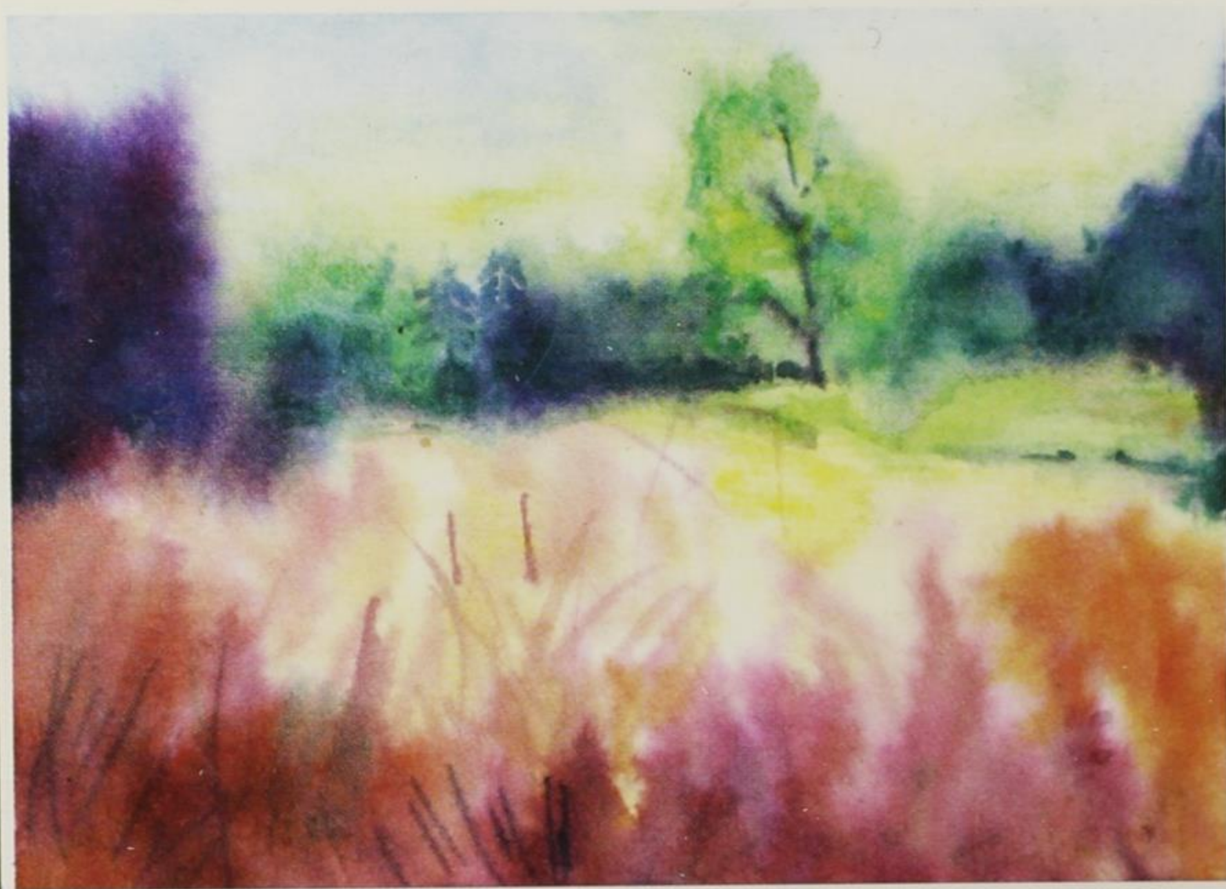
Предео код Брезовице